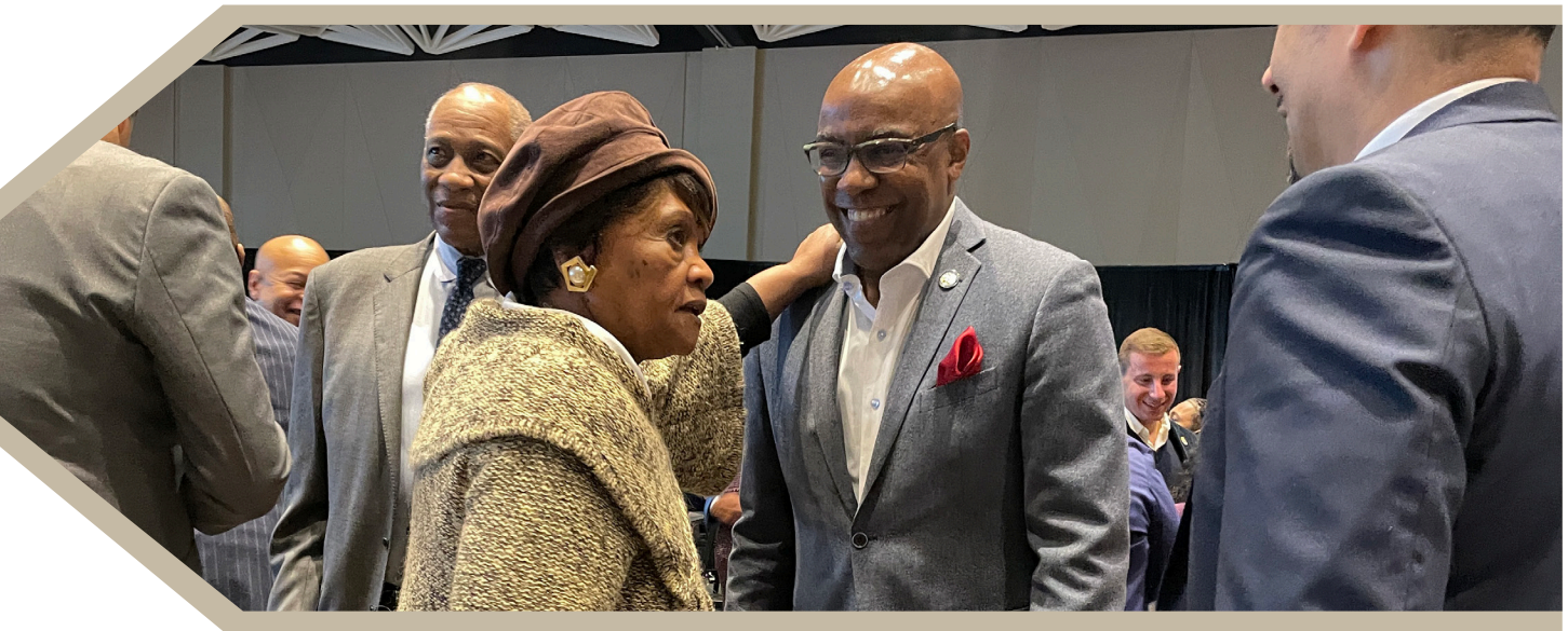
En enero del año 2024, el Procurador General Raoul asistió al 38° desayuno interreligioso anual en Chicago. El Procurador General Raoul trabaja con varias partes interesadas para defender los derechos de los trabajadores.

De manera similar, en julio del año 2024, el Procurador General Raoul anunció un trato con Elite Staffing Inc., una de las agencias temporales que se alegó participó en este acuerdo para no contratar a los empleados de la competencia. Bajo el trato, Elite acordó pagar 1.5 millones de dólares para compensar a trabajadores impactados por esta práctica ilegal y acordó también notificar a los trabajadores de sus derechos y a prevenir violaciones similares en el lugar de trabajo de sus otros clientes.