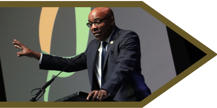
El Procurador General Raoul habla en una conferencia celebrada por Blacks in Green, una organización comunitaria para la justicia ambiental. La Oficina del Procurador General se asocia con entidades estatales y federales para abogar por políticas que protegen a los trabajadores de lesiones en los lugares de trabajo peligrosos.

La Oficina del Procurador General trabaja con procuradurías generales estatales a través del país para promover los derechos de los trabajadores, incluyendo a nivel federal. La oficina frecuentemente hace recomendaciones sobre regulaciones federales que fortalecerían los derechos de los trabajadores, archiva escritos amicus en litigación con implicaciones nacionales para los trabajadores, y manda cartas al liderazgo congresista promoviendo propuestas de leyes para el beneficio de los trabajadores. Cuando las leyes y las regulaciones federales que son propuestas o implementadas hieren a los trabajadores, nuestra oficina trabaja con otras oficinas de procuraduría general para archivar demandas contra el gobierno federal y escritos amicus en apoyo a los trabajadores.