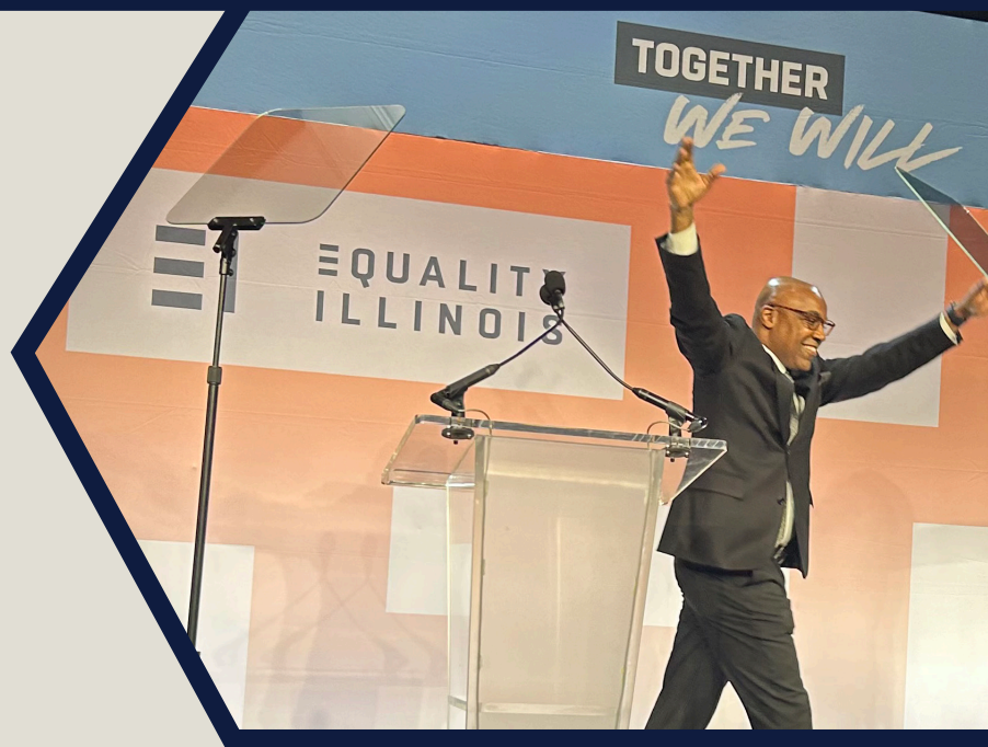
El Procurador General Raoul cruza el escenario en la gala celebrada por Igualdad Illinois el día 3 de febrero del año 2024. La Oficina del Procurador General trabaja con la Asamblea General, agencias estatales, y otras partes interesadas para fortalecer a las políticas que protegen a los trabajadores de la discriminación.

combatir la discriminación al mejorar las protecciones de los derechos civiles del pueblo de Illinois. La legislación aumenta de forma dramática la habilidad de la Oficina del Procurador General para remediar la discriminación al otorgar a la oficina autoridad para obtener restitución para las víctimas de discriminación. Además, la legislación aumenta las cantidades máximas que podemos obtener como multas contra violadores de la ley. Por ejemplo, un negocio que discrimina contra sus empleados rutinariamente puede ser sujeto a una multa por cada empleado que ha sido víctima de discriminación. Las enmiendas también clarifican que las víctimas tienen derecho a tomar acción para coleccionar juicios obtenidos por el estado aun si no participan en una acción del estado para hacer la ley cumplir. El Gob. Pritzker firmó la propuesta de ley en agosto del año 2024. La ley estará en efecto en su totalidad a partir del día 1 de enero del año 2025.