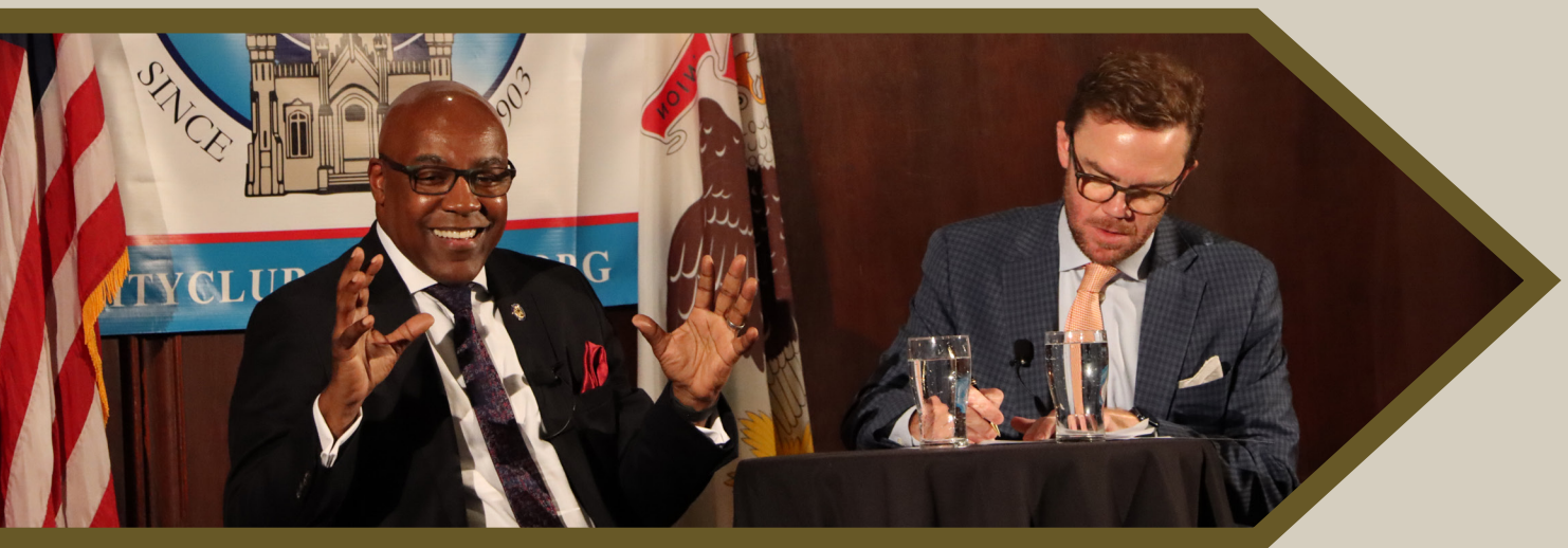
El Procurador General Raoul habla en un almuerzo político celebrado por City Club en Chicago en septiembre del año 2023. El Procurador General actualiza al público frecuentemente sobre los esfuerzos de su oficina de proteger y defender a la gente de Illinois.

Resguardando Reglas que Protegen a los Trabajadores Alrededor de las Químicas: En agosto del año 2022, la Oficina del Procurador General apoyo una nueva regla de seguridad propuesta por la Agencia de Protección Ambiental de los Estados Unidos (EPA por sus siglas en inglés) sobre los accidentes químicos. La EPA publicó una regla final en marzo del año 2024 que fortaleció las protecciones que previenen los accidentes químicos, siguiendo muchas de las recomendaciones ofrecidas por la Oficina del Procurador General en un comentario. La regla final fue desafiada en la Corte de Apelaciones del Distrito de Columbia por varios adversarios estatales y grupos industriales en mayo del año 2024, y en junio del mismo año, la Oficina del Procurador General se unió con una coalición de estados para intervenir en defensa de la EPA y la regla. Esta litigación continua.